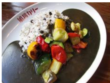
《ゴロゴロ野菜カレー》