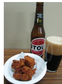
《ちょい飲みセット》