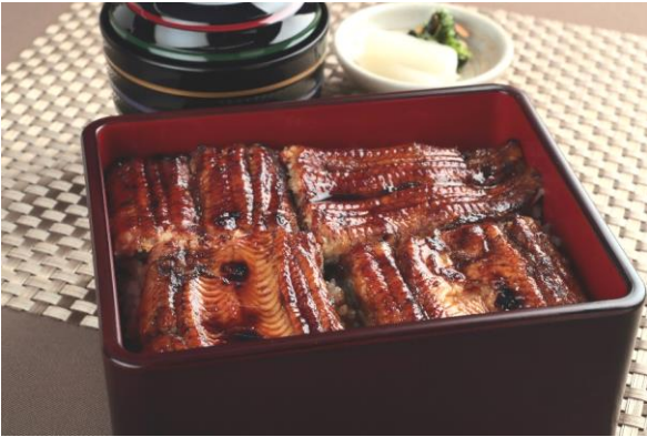
写真はうな重(大)です