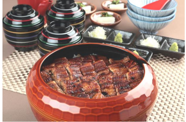
写真はおひつまぶし(3人前)です