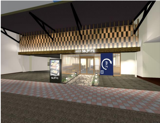
店舗入口イメージ