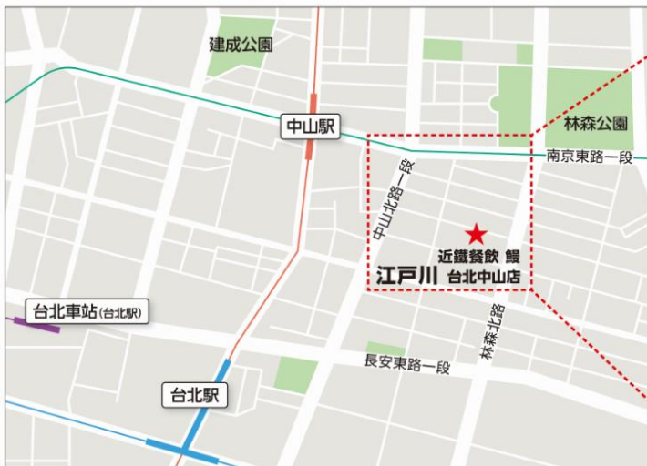
台北市 台北・中山周辺