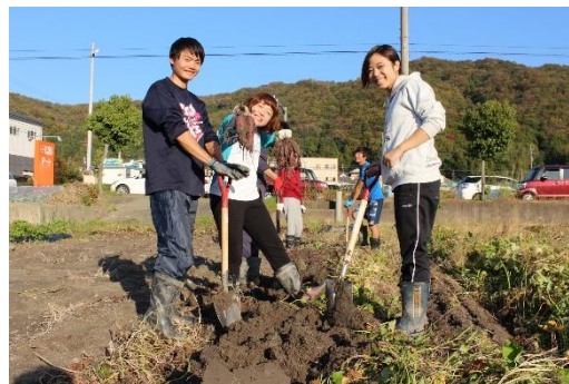
実習農場でのサツマイモの収穫の様子

近畿大学農学部農業生産科学科では、認定制度「アグリビジネスマイスター」を開設し、3年生を対象に「アグリビジネス実習(通年)」を行っています。本実習では、平群町の耕作放棄地を再生した農場において、農産物の作付け計画から栽培、管理、収穫、加工や販売までを一貫して学びます。平成29年度(2017年度)は、3年生40人が受講しています。