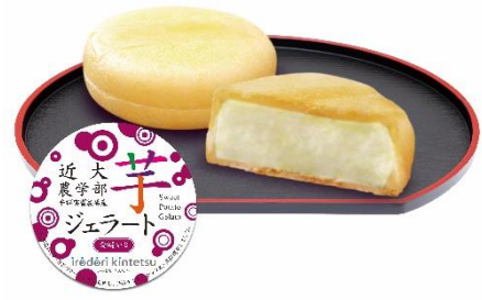
近大農学部 平群実習農場産 芋ジェラート(金時いも)

近畿大学農学部(奈良県奈良市)と、奈良県平群町の協力のもとに(株)近鉄リテーリングが企画し、(株)テnderボックスと共同開発した近鉄沿線地域商品ブランド「irodori kintetsu」第4弾の「近大農学部平群実習農場産 芋ジェラート(金時いも)」のリニューアル商品を、平成30年(2018年)1月25日(木)※より数量限定で販売します。昨年より金時いものペーストを20%増量しています。 ※一部店舗では販売開始日が異なります。